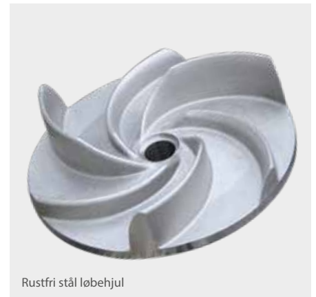
Rustfri stål løbehjul