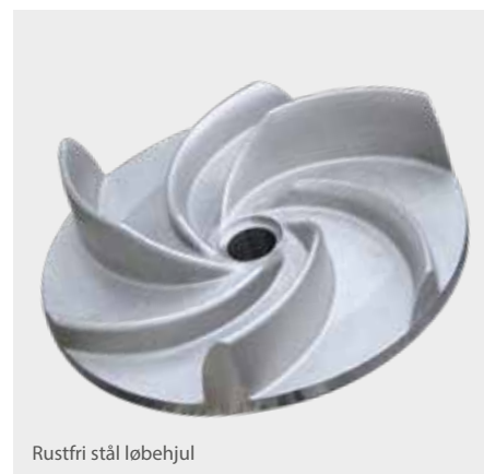
Rustfri stål løbehjul