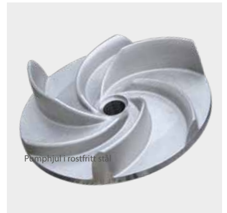
Pumphjul i rostfritt stål