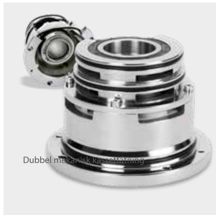
Dubbel mekanisk kassetätning