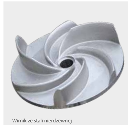
Wirnik ze stali nierdzewnej