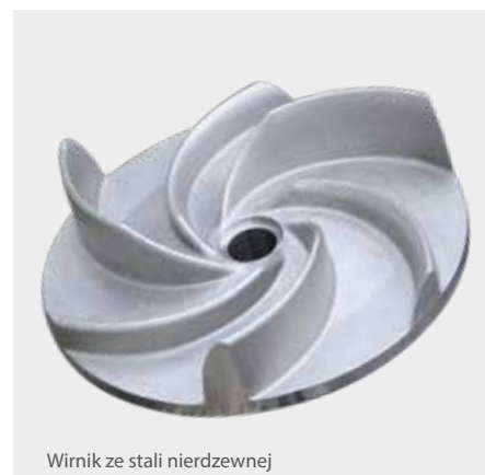
Wirnik ze stali nierdzewnej