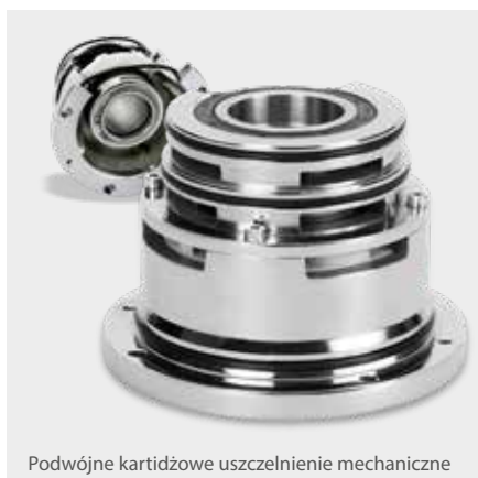
Podwójne kartidżowe uszczelnienie mechaniczne